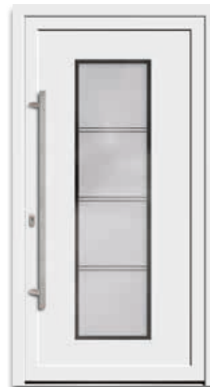
Modell 5570-50 | D1+D2 Glas: G 1277 mattiertes Glas mit klarem Rand Griff: 1042-13 Edelstahl