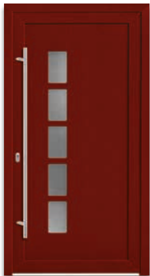
Modell 5017-50 | D1+D2 Glas: Master-carré weiß Extras: Dekor Dunkelrot Griff: 9028-13 Edelstahl