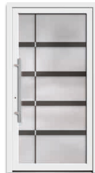
Modell 6289-01 2-fach Verglasung: mattiertes Glas mit klaren Streifen Griff: 9024-13 Edelstahl