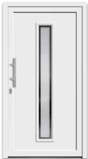
Modell 5177-60 | D1 Glas: G 500-25 mattiertes Glas mit klarem Rand Griff: 9022-13 Edelstahl