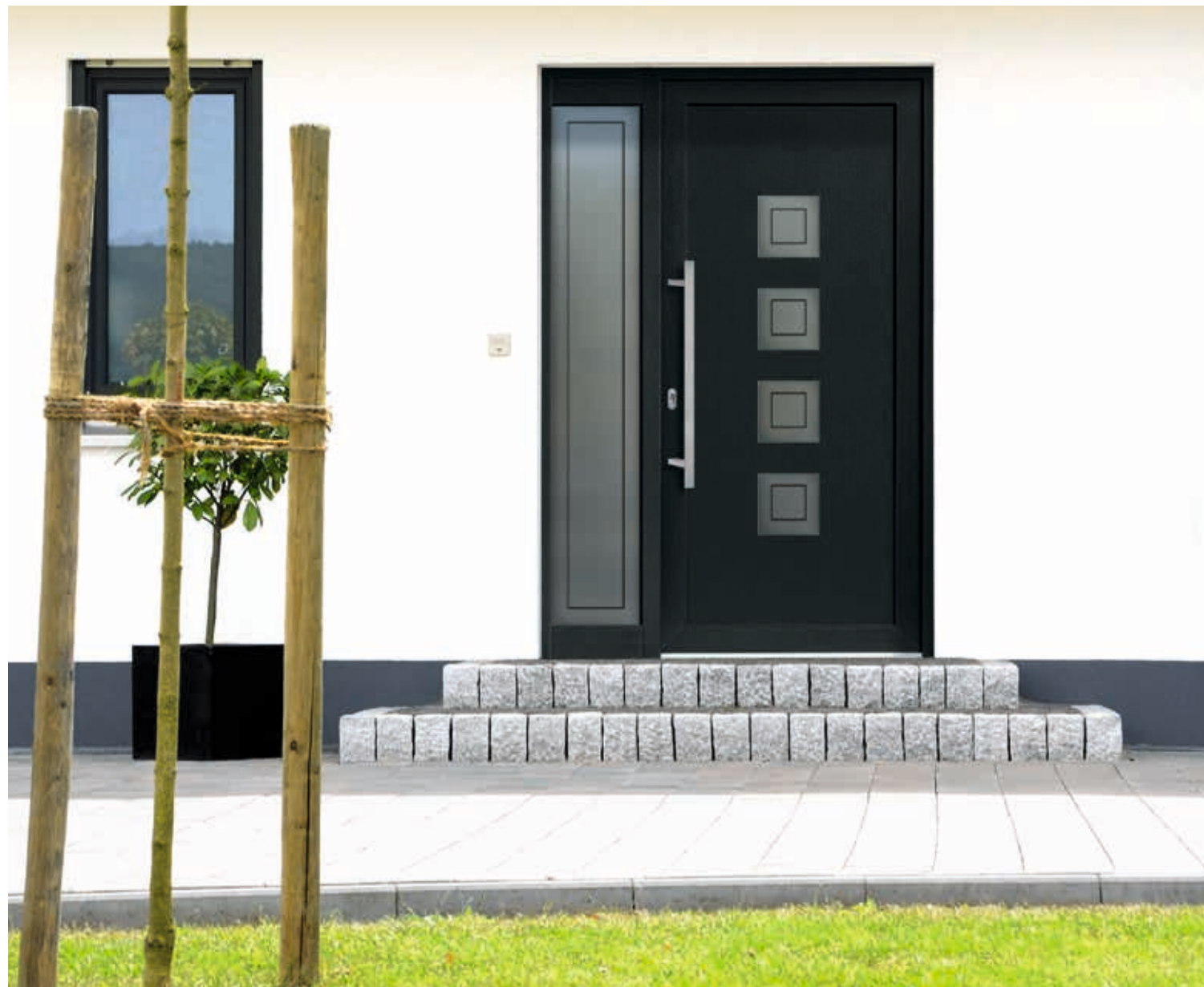
Modell 5504-50 | D1+D2 | Glas: G 1416 mattiertes Glas mit klarem Motiv | Extras: Dekor Anthrazitgrau | Griff: 1040-13 Edelstahl