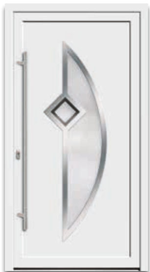
Modell 5558-70 | D1+D2 Rahmen – Edelstahloptik Glas: G 1413 mattiertes Glas mit klarem Rand Griff: 9027-13 Edelstahl