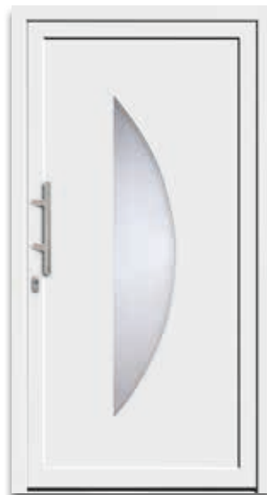
Modell 5114-50 | D1+D2 Glas: Klarglas Griff: 9022-13 Edelstahl