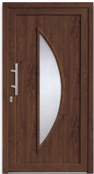
Modell 5114-60 | D1 Glas: Klarglas Extras: Dekor Nussbaum Griff: 9022-13 Edelstahl