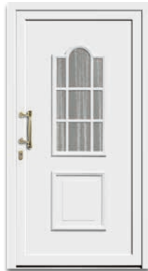
Modell 5117-15 | D1 Extras: Glas Chinchilla weiß Griff: 9002-1 Messing poliert