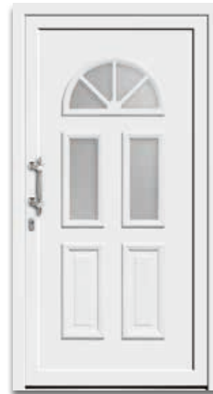
Modell 5215-25 | D1 Extras: Glas Satinato weiß Griff: 8764-13 Edelstahl