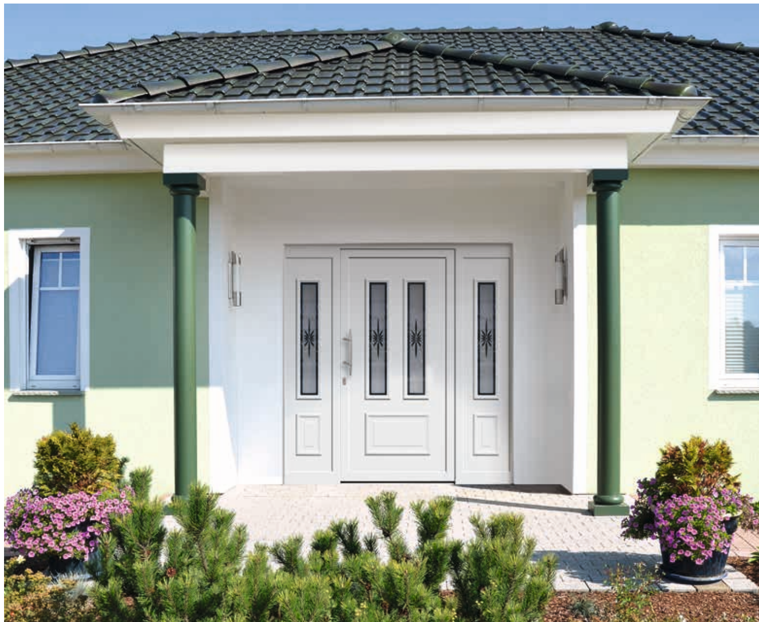
Modell 5545-10 | D1 | Glas: G 1073 mattiertes Glas mit klarem Motiv | Griff: 9048-13 Edelstahl