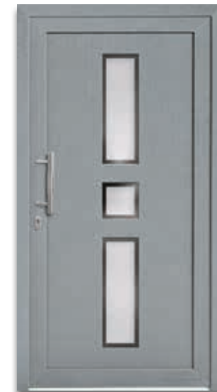
Modell 5451-50 | D1+D2 Glas: G 500-25 mattiertes Glas mit klarem Rand Extras: Dekor Grau Griff: 1022-13 Edelstahl