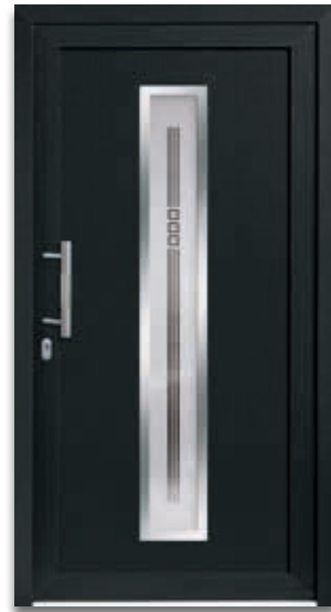
Modell 5177-70 | D1+D2 Rahmen – Edelstahloptik Glas: G 1002 mattiertes Glas mit klarem Motiv Extras: Dekor Anthrazitgrau Griff: 1022-13 Edelstahl