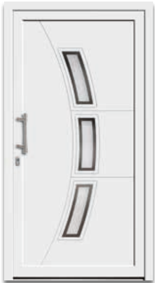
Modell 5883-52 | D1+D2 Glas: G 500-25 mattiertes Glas mit klarem Rand Griff: 1021-13 Edelstahl