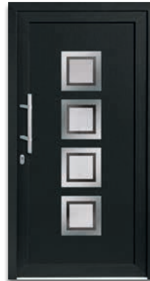
Modell 5504-70 | D1+D2 Rahmen – Edelstahloptik Glas: G 500-20 mattiertes Glas mit klarem Rand Extras: Dekor Anthrazitgrau Griff: 9022-13 Edelstahl