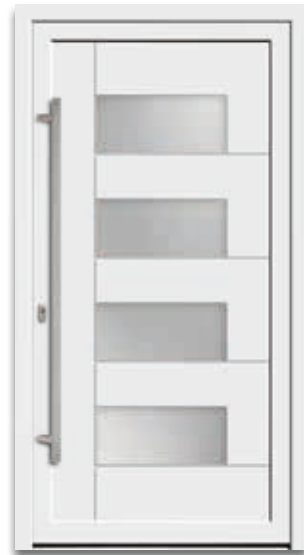
Modell 5876-52 | D1+D2 Extras: Glas Satinato weiß Griff: 1043-13 Edelstahl