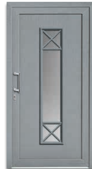
Modell 5286-65 | D1 Extras: Dekor Grau | Glas Satinato weiß Griff: 9016-5 Chrom