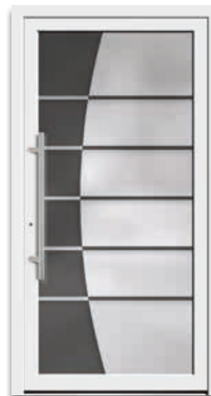
Modell 6242-01 2-fach Verglasung: mattiertes Glas mit klaren Streifen und klarem Motiv Griff: 9024-13 Edelstahl