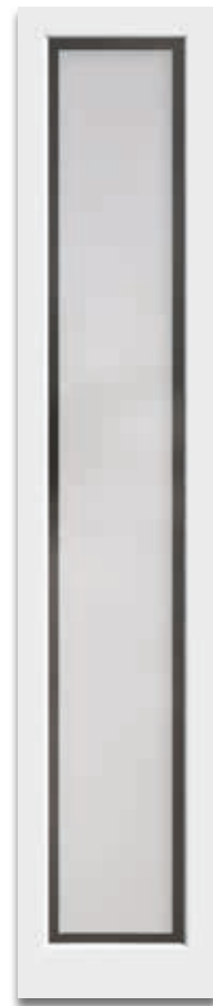
Verglasung „mattiertes Glas mit klarem Rand“.

„Der Klassiker“ – passt zu jedem Modell. Modern und stilsicher.