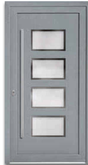
Modell 5450-50 | D1+D2 Glas: G 500-25 mattiertes Glas mit klarem Rand Extras: Dekor Grau Griff: 9028-13 Edelstahl