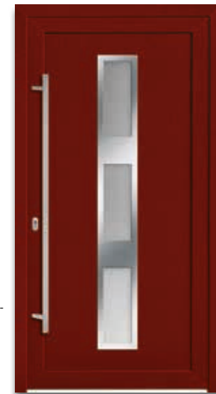
Modell 5724-77 | D1+D2 Rahmen – Edelstahloptik Extras: Dekor Dunkelrot | Glas Satinato weiß Griff: 1043-13 Edelstahl