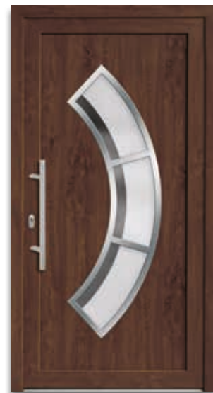
Modell 5882-75 | D1+D2 Rahmen – Edelstahloptik Glas: G 936 mattiertes Glas mit klarem Streifen Extras: Dekor Nussbaum Griff: 9023-13 Edelstahl