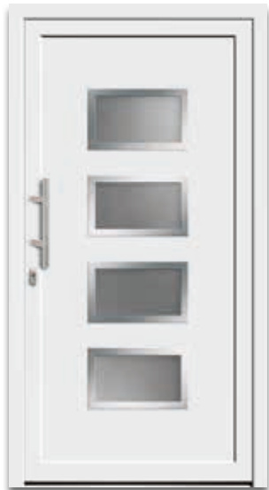
Modell 5470-70 | D1+D2 Rahmen – Edelstahloptik Extras: Glas Mastercarré weiß Griff: 9022-13 Edelstahl