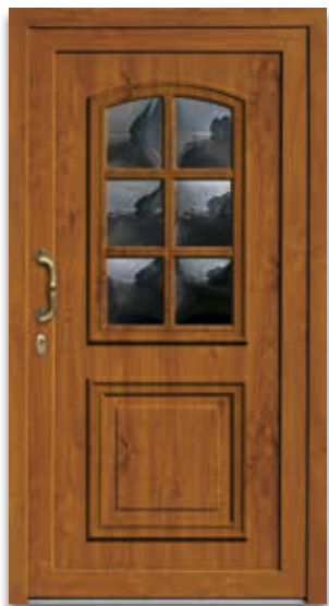
Modell 5414-15 | D1 Glas: Klarglas gewölbt Extras: Dekor Golden Oak Griff: 701-2 Messing brüniert