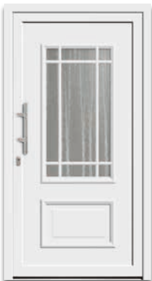
Modell 5887-15 | D1 Extras: Glas Chinchilla weiß Griff: 9022-13 Edelstahl