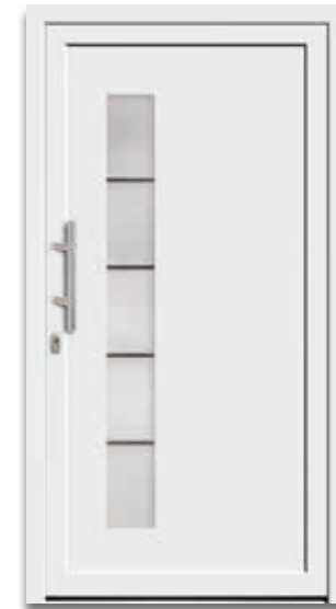
Modell 5178-50 | D1+D2 Glas: G 1313 mattiertes Glas mit klaren Streifen Griff: 9022-13 Edelstahl