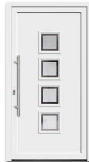
Modell 5504-60 | D1 Glas: G 500-20 mattiertes Glas mit klarem Rand Griff: 9024-13 Edelstahl