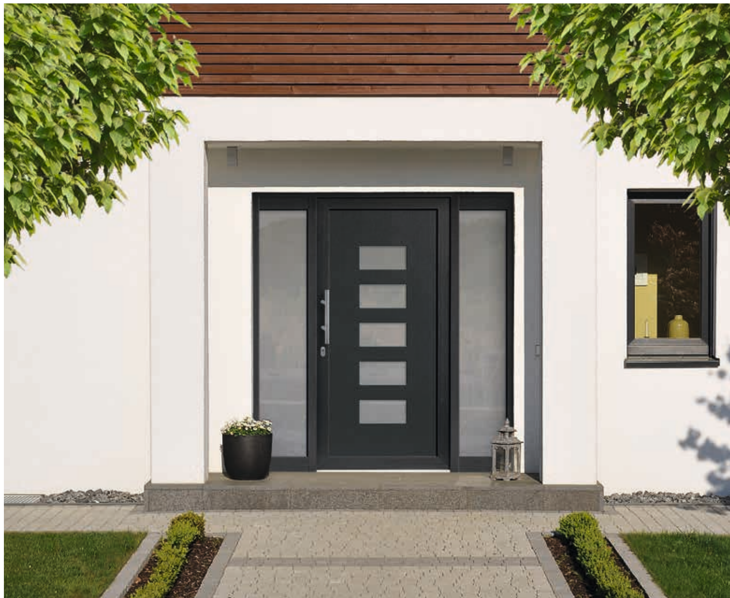
Modell 5873-50 | D1+D2 | mit Ganzglas Seitenteilen | Extras: vollflächig mattiertes Glas | Dekor Anthrazitgrau | Griff: 9022-13 Edelstahl