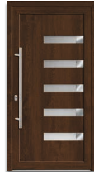
Modell 5874-57 | D1+D2 Applikationen – Edelstahloptik Extras: Dekor Staufereiche terra | Glas Satinato weiß Griff: 9025-13 Edelstahl