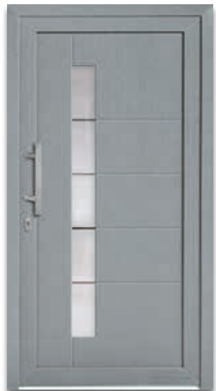
Modell 5869-52 | D1+D2 Glas: G 1070 mattiertes Glas mit klaren Streifen Extras: Dekor Grau Griff: 1038-13 Edelstahl