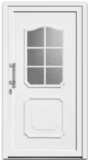
Modell 5202-15 | D1 Extras: Glas Mastercarré weiß Griff: 764-5 Chrom