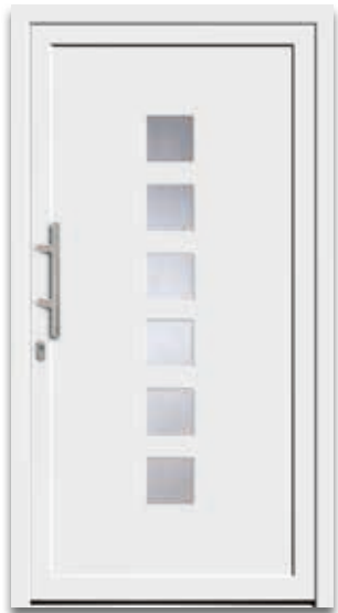
Modell 5872-50 | D1+D2 Glas: Klarglas Griff: 9022-13