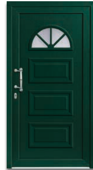
Modell 5315-15 | D1 Extras: Dekor Dunkelgrün | Glas Satinato weiß Griff: 8730-6 Chrom