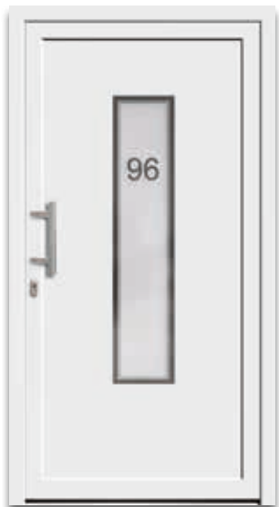
Modell 5115-50 | D1+D2 Glas: G 1387 mattiertes Glas mit klarem Rand und Motiv (Hausnr.) Griff: 1013-13 Edelstahl