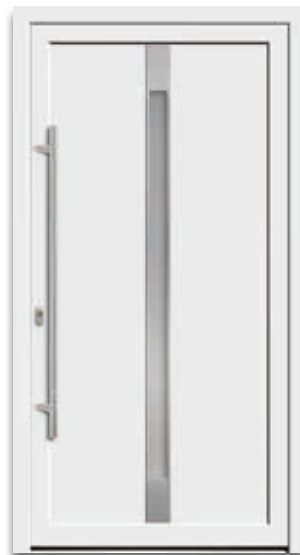
Modell 5563-57 | D1+D2 Rahmen – Edelstahloptik Extras: Glas Satinato weiß Griff: 9026-13 Edelstahl