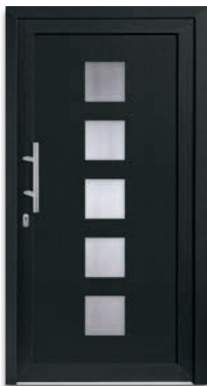
Modell 5505-50 | D1+D2 Glas: Klarglas Extras: Dekor Anthrazitgrau Griff: 9022-13 Edelstahl