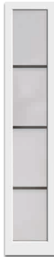
Verglasung „mattiertes Glas mit klaren Streifen“ – optional klare Streifen + klarer Rand.

„Der Klassiker“ – passt zu jedem Modell. Modern und stilsicher.