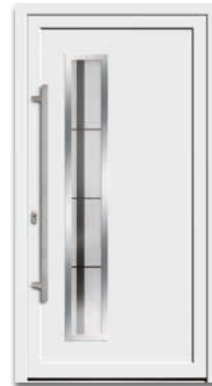
Modell 5178-70 | D1+D2 Rahmen – Edelstahloptik Glas: G 1182 mattiertes Glas mit waagerechten und senkrechten filigranen, klaren Streifen Griff: 1042-13 Edelstahl