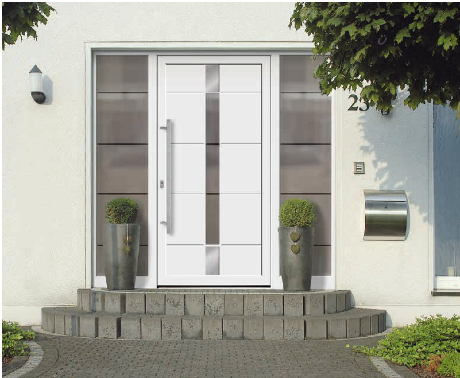
Modell 5564-57 | D1+D2 | Applikationen – Edelstahloptik | mit Ganzglas-Seitenteilen | Glas: G 1274 mattiertes Glas mit klaren Streifen | Griff: 1041-13 Edelstahl