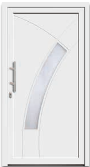
Modell 5165-52 | D1+D2 Extras: Glas Satinato weiß Griff: 9022-13 Edelstahl