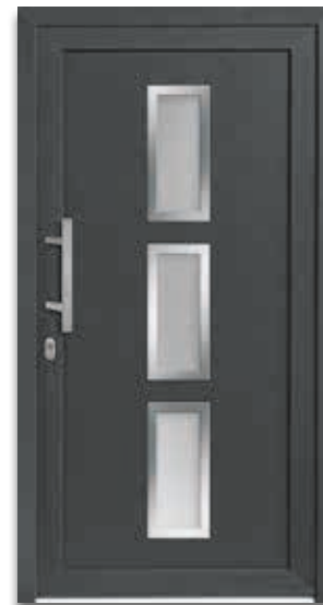
Modell 5725-70 | D1+D2 Rahmen – Edelstahloptik Extras: Dekor Basaltgrau | Glas Satinato weiß Griff: 1038-13 Edelstahl