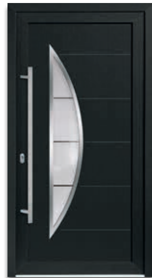
Modell 5878-72 | D1+D2 Rahmen – Edelstahloptik Glas: G 1063 mattiertes Glas mit klaren Streifen Extras: Dekor Anthrazitgrau Griff: 1042-13 Edelstahl