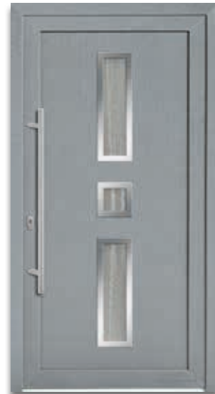
Modell 5471-70 | D1+D2 Rahmen – Edelstahloptik Extras: Dekor Grau | Glas Chinchilla weiß Griff: 9025-13 Edelstahl