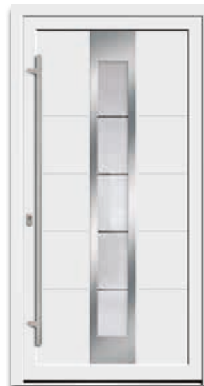
Modell 5867-77 | D1+D2 Rahmen – Edelstahloptik Glas: G 1150 mattier- tes Glas mit klaren Streifen Griff: 9028-13 Edelstahl