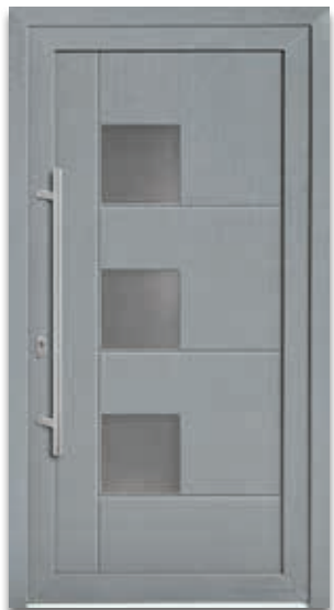
Modell 5718-52 | D1+D2 Extras: Dekor Grau | Glas Mastercarré weiß Griff: 9025-13 Edelstahl