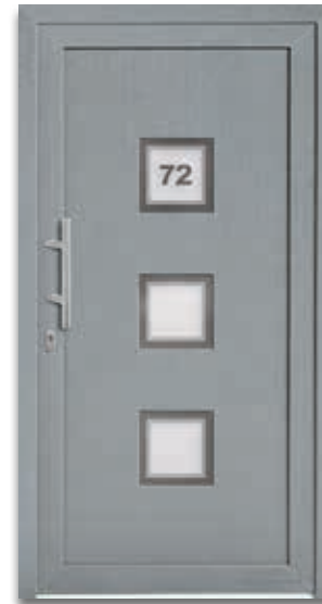
Modell 5418-50 | D1+D2 Glas: G 1393 mattiertes Glas mit klarem Rand und Motiv (Hausnr.) Griff: 9022-13 Edelstahl