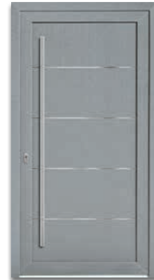
Modell 5814-94 | D1+D2 Lisenen – Edelstahloptik Extras: Dekor Grau Griff: 9028-13 Edelstahl, auf Türblatt montiert