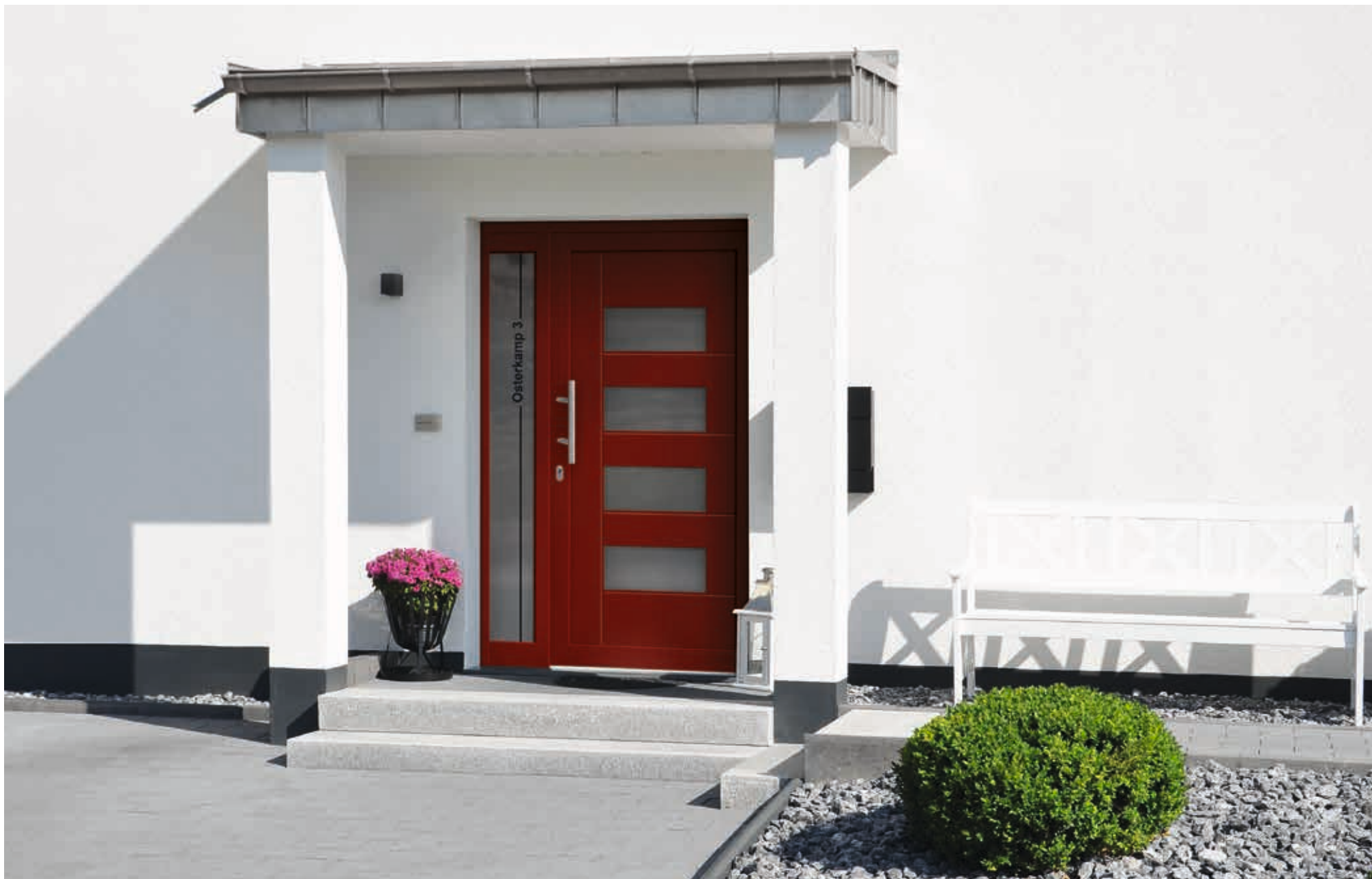
Serie D | Modell 5876-52 | D1+D2 | mit Ganzglas-Seitenteil | Extras: Dekor Dunkelrot | vollflächig mattiertes Glas | Glas Seitenteil: G 1402 mattiertes Glas mit klarem Motiv (Straßenbezeichnung) | Griff: 9022-13 Edelstahl