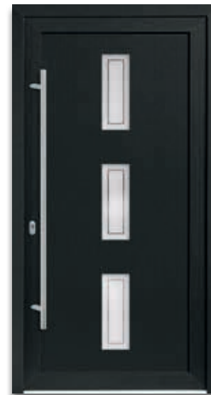
Modell 5725-50 | D1+D2 Glas: G 1397 mattiertes Glas mit klarem Motiv Extras: Dekor Anthrazitgrau Griff: 9027-13 Edelstahl