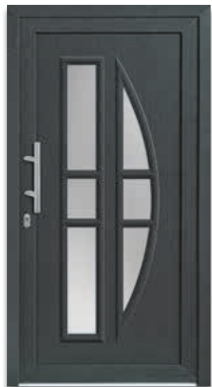
Modell 5880-65 | D1 Extras: Dekor Basaltgrau | Glas Satinato weiß Griff: 9022-13 Edelstahl