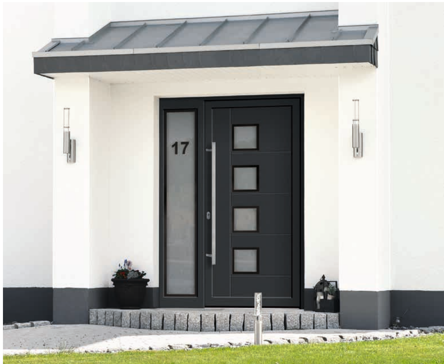
Modell 5577-52 | D1+D2 | mit Seitenteil | Glas: G 500-25 mattiertes Glas mit klarem Rand | Glas Seitenteil: G 515 mattiertes Glas mit klarem Rand und Motiv (Hausnr.) Extras: Dekor Anthrazitgrau | Griff: 1042-13 Edelstahl