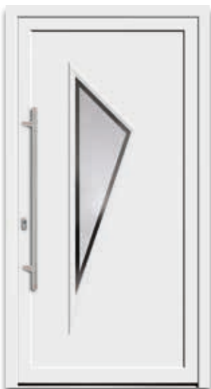
Modell 5112-60 | D1 Glas: G 500-25 mattiertes Glas mit klarem Rand Griff: 9025-13 Edelstahl