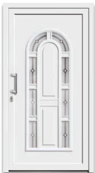
Modell 5856-11 | D1 Glas: G 1411 mattiertes Glas mit klarem Motiv Griff: 9016-5 Chrom