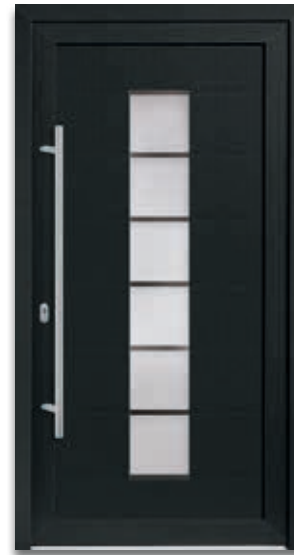
Modell 5868-52 | D1+D2 Glas: G 913 mattier- tes Glas mit klaren Streifen Extras: Dekor Anthrazitgrau Griff: 9026-13 Edelstahl