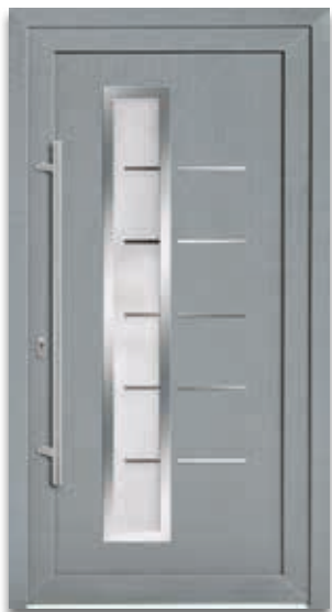
Modell 5658-77 | D1+D2 Glas: G 1399 mattiertes Glas mit klaren Streifen Extras: Dekor Grau Griff: 9026-13 Edelstahl