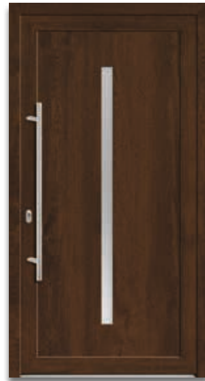
Modell 5865-50 | D1+D2 Extras: Dekor Staufereiche terra | Glas Satinato weiß Griff: 9025-13 Edelstahl