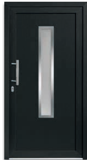
Modell 5172-70 | D1+D2 Rahmen – Edelstahloptik Extras: Dekor Anthrazitgrau | Glas Satinato weiß Griff: 1022-13 Edelstahl